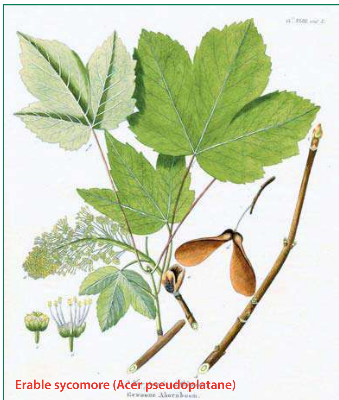
Erable sycomore (Acer pseudoplatane)